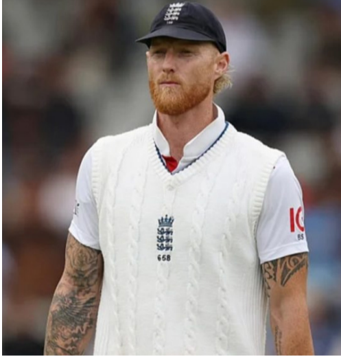
అలాగే ఆస్ట్రేలియా 100 పరుగులకు తక్కువ కట్టడి చేయాలింది. ఆస్ట్రేలియా అద్భుతమైన జట్టు. అందులో వ్యక్తిగత ప్రదర్శనలతో జట్టును ఆడుకునే ఆటగాళ్లు ఉన్నారు. ఈ విజయం క్రికెట్ పూర్తిగా వారికే దక్కుతుంది. అయితే ఈ సిరీస్ లో మేం ఇంకాస్త మెరుగైన రాణించాలింది. మా లోపాలను సమీక్షించుకోవడానికి ఇది సరైన సమయం కాదు. ఈ ఓటమిని విశ్లేషించుకోవడానికి మాకు చాలా సమయం ఉంది. వచ్చే జూన్ లో మేం మళ్లీ టెస్ట్ క్రికెట్ ఆడనున్నాం. ఆ సమయానికి మా తప్పులను సరిదిద్దుకుంటాం. ఈ మ్యాచ్ లో జాకోబ్ బెజెట్ ఆడిన ఇన్నింగ్స్ అద్భుతం. జోషి టంగ్ ప్రదర్శన రోజురోజుకూ మెరుగువుతుంది. అతను నిలకడగా రాణిస్తున్నాడు. మా జట్టులో అసాధారణ ఆటగాళ్లు ఉన్నారు. అని బెన్ స్ట్రాక్స్ చెప్పుకొచ్చాడు. ఈ సిరీస్ లో ఓడినా కెప్టెన్ గా కొనసాగుతానని తెలిపాడు.

బ్యాటింగ్ వైఫల్యంతోనే ఓటమిపోయామని ఇంగ్లాండ్ టెస్ట్ కెప్టెన్ బెన్ స్ట్రాక్స్ తెలిపారు. ప్రతిష్టాత్మక యాషెస్ సిరీస్ అంతిమ టెస్ట్ లో భాగంగా సిడ్నీ వేదికగా జరిగిన టెస్ట్ లోనూ ఆసిస్ 5 వికెట్లతో ఇంగ్లాండ్ ను చిత్తు చేసింది. ఈ గెలుపుతో ఈ ఐదు టెస్టుల సిరీస్ ను 41 టెస్ట్ లు చేసుకుంది. అఖిల్ టెస్ట్ అనంతరం మాట్లాడిన బెన్ స్ట్రాక్స్, "తొలి ఇన్నింగ్స్ లో అందంగా 100 పరుగులు చేసి ఉంటే ఫలితం మరేదా ఉండేదన్నాడు. ఆస్ట్రేలియాకు కూడా తొలి ఇన్నింగ్స్ లో 100 పరుగులు తక్కువగా ఇచ్చాల్సింది అభిప్రాయపడ్డాడు. 'నా కలం కాదు' అన్న మెరుగ్గానే ఉంది. కొన్నిసార్లు తీవ్ర నొప్పితో ఇన్నింగ్స్ పడుతున్నాము. ఇంటికి వెళ్లే వరకు ఈ గాయం పుస్తకం కాదు. ఈ మ్యాచ్ లో ఓడినా భాగమప్పుడం ఒక గొప్ప అనుభవం. మేం తొలి ఇన్నింగ్స్ లో మరో 100 పరుగులు అడగడం చేసి ఉండాలింది."