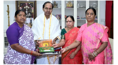
సత్కరించారు. కేసీఆర్ దంపతులు ఇచ్చిన తేనీటి విందు స్వీకరించిన మంత్రులు.. యోగక్షేమాలు అడిగి తెలుసుకున్నారు. తొలుత, ఎర్రవెల్లి నివాసానికి చేరుకున్న మహిళా మంత్రులకు మాజీ ఎంపీ జోగినపల్లి సంతోష్ కుమార్ ఆహ్వానం పలికారు.

ఎర్రవెల్లిలోని తన నివాసానికి వచ్చిన మహిళా మంత్రులను భారత రాష్ట్రసమితి అధినేత కేసీఆర్ ఆత్మీయంగా పలకరించారు. అతిథి మర్యాదలతో పసుపు, కుంకుమ, చీర, తాంబూలాలతో సత్కరించారు. తెలంగాణ రాష్ట్ర మంత్రులు సీతక్క, కొండా సురేఖ గురువారం కేసీఆర్‌ను మర్యాదపూర్వకంగా కలిసి.. మేడార జాతర ఆహ్వాన పత్రికను అందజేశారు. మేడారం ప్రసారం అందజేసి.. మరి కొద్ది రోజుల్లో ప్రారంభం కానున్న జాతరను సందర్భించిందిగా రాష్ట్ర ప్రభుత్వం తరఫున ఆహ్వానం పలికారు. ఈ సందర్భంగా.. తన ఇంటికి వచ్చిన ఆదర్శమైన ఆత్మీయంగా పలకరించి.. సాదరంగా ఆహ్వానించిన కేసీఆర్ దంపతులు సాంప్రదాయ పద్ధతిలో