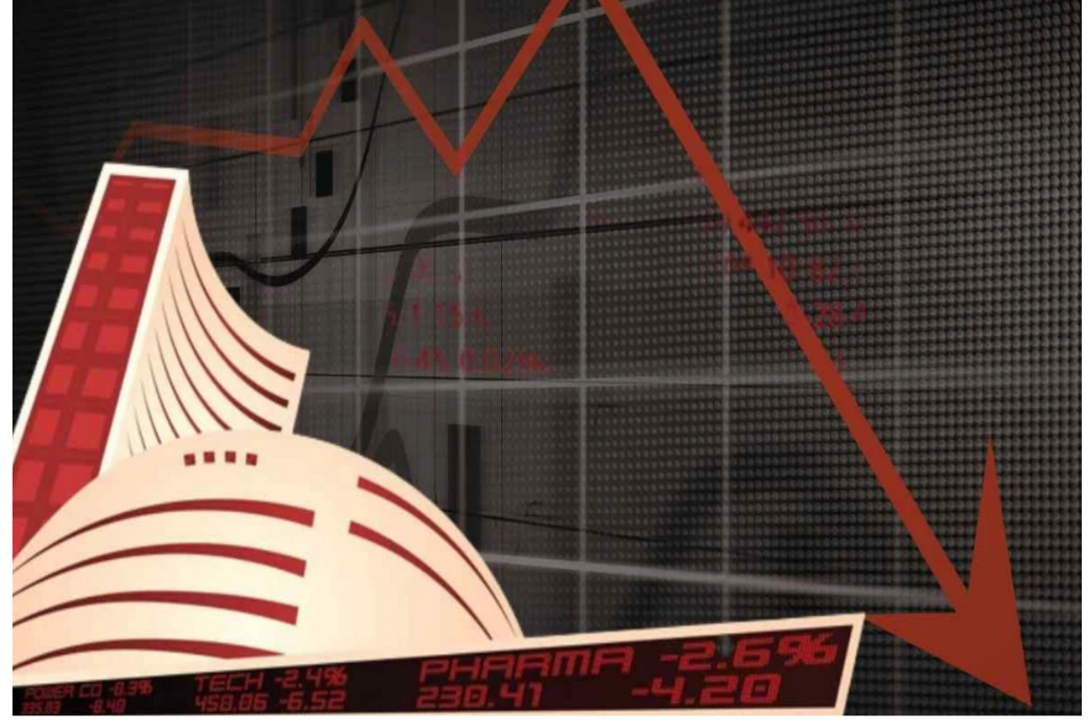
ఉంది. సెన్సెక్స్ 30 సూచీలో ప్రధానంగా ఎన్టీపీసీ, ఐసీఐ బ్యాంక్, అదానీ డిపోజిట్, భారత్ ఎయిర్లెస్ ల, సస్పెన్షన్ షేర్ల నష్టపోయాయి. ఏషియన్ మెయిల్స్, హెచ్సీఎల్ టెక్నాలజీస్, బీఈఎల్, రిలయన్స్, ఎటెర్నల్ షేర్ల లాభపడ్డాయి. అంతర్జాతీయ వివరణలో బ్రెట్ క్రూడ్ బ్యాంకర్ ధర 62.12 డాలర్ల వద్ద కొనసాగుతుండగా.. బంగారం ఔస్సు 4,471 డాలర్ల వద్ద ట్రేడ్వేతోంది.

ముంబయి: దేశీయ స్టాక్ మార్కెట్ సూచీలు వరుసగా ఐదో రోజు సప్టైల్లోనే ముగిశాయి. అంతర్జాతీయ మార్కెట్ల నుంచి ప్రతికూల సంతకాలు, ఎఫ్ఐఐ బల అమ్మకాలు ప్రభావం చూపాయి. ముఖ్యంగా రియల్టీ, కన్స్ట్రక్షన్ ద్యూరబిల్స్, ఆటో స్టాక్స్ అమ్మకాల ఒత్తిడిని ఎదుర్కొన్నాయి. ఈ క్రమంలో నే సెన్సెక్స్ 600 పాయింట్లకు పైగా నష్టపోగా.. నిష్పేట 25,700 దిగువకు చేరింది. గడిచిన ఐదు ట్రేడింగ్ సెషన్లలో సెన్సెక్స్ 2,200 పాయింట్లకు పైగా పతనమైంది. అమెరికా అధ్యక్షుడు డొనాల్డ్ ట్రంప్ టారిఫ్లపై ఆ దేశ సుప్రీంకోర్టు నేటి (శుక్రవారం) రాత్రి తీర్పు వెలువరించనుంది. ఒకవేళ ఆయనకు వ్యతిరేకంగా తీర్పు వస్తే మన మార్కెట్లకు ఊరట కలుగుతుంది. అనుకూలంగా తీర్పు వస్తే ఆయా దేశాలపై మరన్ని టారిఫ్లు విధించేందుకు ఊతం ఇచ్చినట్లు అవుతుంది. ఇది మార్కెట్లకు ప్రతికూలం అంశం. ఈ నేపథ్యంలో ఈ వారాంతంలో మదుపర్ల అభ్యుత్సాహం తగ్గిపోవచ్చు.