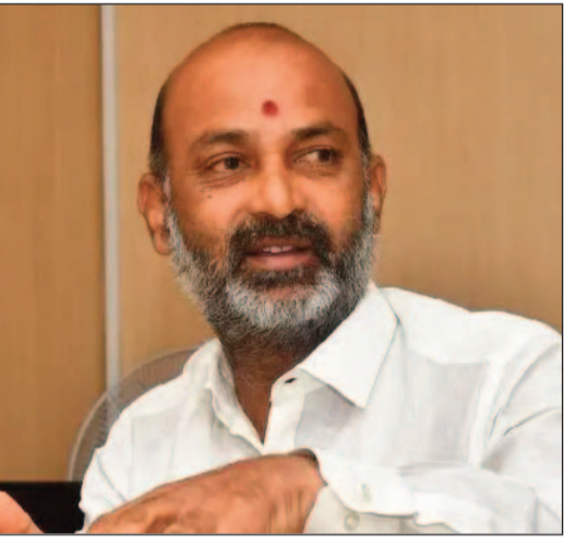
అన్ని ప్రధాన ఐటి కంపెనీల హెచ్ఆర్ డివిజన్లతో తక్షణ సమావేశం నిర్వహించాలని సూచించారు. ఉద్యోగుల భద్రతపై స్పష్టమైన విధానాలు రూపొందించాలని అన్నారు. ఉద్యోగుల

ఫిర్యాదులపై కఠిన చర్యలు తీసుకోవాలని, ఏ కేసును కూడా దాచిపెట్టకూడదని చెప్పాకాన్నారు. ఉద్యోగులు కార్యాలయాల్లో స్వేచ్ఛగా, భద్రతతో పనిచేసే వాతావరణం ఉండాలని బండి సంజయ్ కుమార్ సూచించారు. ఏ రకమైన ఒత్తిడి, వేధింపులు, దోపిడీకి అవకాశం ఇవ్వకూడదని స్పష్టం చేశారు. అలాగే, బాధితులు ఒంటరిగా ఉండకుండా వారికి తగిన రక్షణ, మద్దతు అందించాలని సూచించారు. పలువురు ఉద్యోగులు ఇప్పటికే కార్యాలయాల్లో జరిగిన అనుభవాలను నోషల్ మీడియాలో పంచుకుంటున్నారని పేర్కొన్నారు. ఈ హెచ్చరికల సందేశాలను ప్రభుత్వం, కంపెనీలు నిర్లక్ష్యం చేయకూడదని సూచించారు. ఐటి కంపెనీల నాయకులు, హెచ్ఆర్ విభాగాలు ఉద్యోగుల భద్రతకు అత్యధిక ప్రాధాన్యం ఇవ్వాలని బండి సంజయ్ కుమార్ కోరారు. ప్రతి ఫిర్యాదును నిష్పక్షాతంగా, వేగంగా పరిష్కరించాలని అవసరం ఉందని చెప్పారు. నాసిక్ కేసు నేపథ్యంలో వచ్చిన ఈ వ్యాఖ్యలు దేశవ్యాప్తంగా ఐటి రంగ భద్రతపై చర్చను మరింత పెంచాయని తెలిపారు. ఉద్యోగుల రక్షణ, కార్యాలయాల్లో పారదర్శకత, ఫిర్యాదు వ్యవస్థ బలోపేతం వంటి అంశాలు ఇప్పుడు కీలకంగా మారాయని పేర్కొన్నారు.