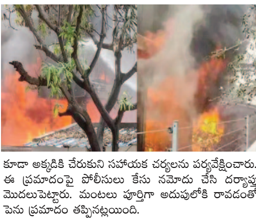
కూడా అక్కడికి చేరుకుని సహాయక చర్యలను పర్యవేక్షించారు. ఈ ప్రమాదంపై పోలీసులు కేసు నమోదు చేసి దర్యాప్తు మొదలుపెట్టారు. మంటలు పూర్తిగా అదుపులోకి రావడంతో పెను ప్రమాదం తప్పినట్లుంది.

కారణమని తెలుస్తోంది. ప్రమాదం జరిగిన సమయంలో భవనంలో మొత్తం 23 మంది నివాసితులు ఉన్నారు. మంటలు వేగంగా వ్యాపిస్తున్న తరుణంలో స్థానికులు వెంటనే అగ్నిమాపక సిబ్బందికి సమాచారం అందించారు. రంగంలోకి దిగిన ఫైర్ సిబ్బంది చాకచక్యంగా వ్యవహరించి, భవనంలో చిక్కుకున్న 23 మందిని సురక్షితంగా బయటకు తీసుకువచ్చారు. ఈ ఘటనలో ఎవరికీ ఎటువంటి గాయాలు కాలేదు. ఎటువంటి ప్రాణనష్టం సంభవించకపోవడంతో అందరూ ఊపిరి పీల్చుకున్నారు. మంటలు భవనంలోని ఇతర అంతస్తులకు వ్యాపించే అవకాశం ఉన్నప్పటికీ, అగ్నిమాపక శాఖ సిబ్బంది త్వరితగతిన స్పందించి పరిస్థితిని అదుపులోకి తెచ్చారు. తీవ్ర శ్రమకోర్చి మంటలను పూర్తిగా ఆర్పివేశారు. భవనం నుంచి పొగలు భారీగా రావడంతో చుట్టూపక్కల వారు కంగారు పడ్డారు. అగ్నిమాపక అధికారులతో పాటు స్థానిక పోలీసులు