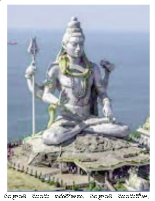
సంక్రాంతి ముందు ఐదురోజులు, సంక్రాంతి ముందురోజు,

సిద్ధాంతం మూలల ద్వారానే మాధ్వమతం ప్రధవిల్లింది. విఘ్నని పరమోన్నతదేవునిగా కీర్తిచిని, శివునికూడా పూజిస్తారు. ప రశురాముడు పరమేశ్వరునివద్ద ధనుర్విద్య నేర్చుకున్నాడు. అయితే పరశురాముడు లింగాకృతిలో ఉ డిపినుందునివసించి లన్న కోరికను తెలిపాడు. దానికి ఆదినారాయ-ణుడైన పరశురాముడు సమ్మతి తెలిపి ఉడిపిలో లింగాకృతిలో వెలిసాడు. శివుని రూపంలో విష్ణువు, అనంతశయముగా, అనంతేశ్వరునిగా... అనంతపద్మనాభు డీగా పూజలు అందుకుంటున్నాడు. వశిష్టకశ్యప భక్తుడైన మయూ రవర్చ, పరశురామ క్షేత్రంలో అనేక వేదాధ్యాయ కేంద్రాలు నెలకొల్పాడు. స హృద్ధి పర్యంత శ్రేణుల్లో సతత, హరిత సుందర రమణీయులతల మధ్య ఉడుపి నిత్యం పచ్చతోరణంగా విరాజిల్లుతోంది. కర్నాటకలో ఇది దక్షిణానవుంది. అ ద్వైతం..ద్వైతం..విశిష్టాద్వైతం ఇలా హైందవ సంస్కృతిలో సత్యానికి అనేక రూపాలు వెలిసాయి. రుక్మిణీదేవి పూజించిన బాలకృష్ణుని విగ్రహం సాలగ్రామ శిలతో రూపొందించబడింది. విశ్వకర్మ దీనిని తయారు చేశాడు. కొన్నాళ్ళకు సముద్రజ్వాలలో ఉంది. తదుపరి మధ్యాచార్యునికి ఉడిపి ప్రాంతంలో దొరికింది. విలిత్రమే మిటంటే పెద్ద గోసీచందనం ముద్ద మధ్యలో బద్ధపరచబడి అనేకతూఫాన్లును ఎదుర్కొని సముద్రయానం చేసింది. అంటే ద్వారాపరం ఉడిపికి చేరిందన్న మాట. మకర