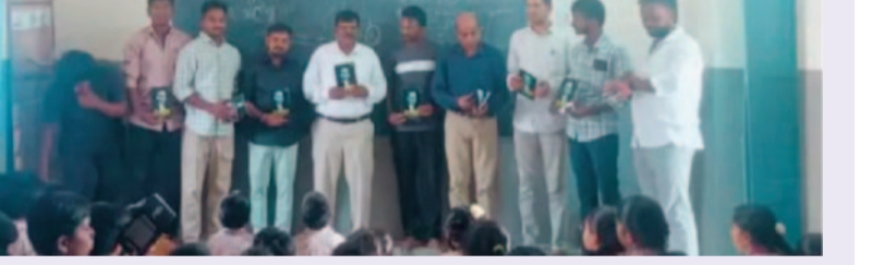
వెల్లండ ఏప్రిల్ 13 (అక్షర గళం)