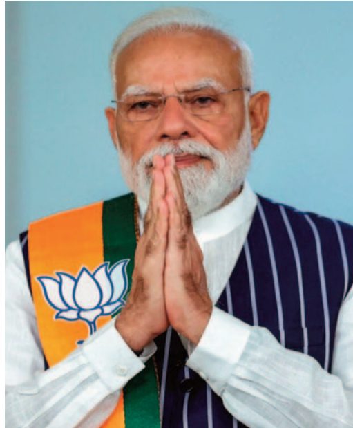
మహిళలకు అన్యాయం చేసినట్లే. 2029 లోక్ సభ

న్యూఢిల్లీ, ఏప్రిల్ 14: రానున్న సార్వత్రిక ఎన్నికల నాటికి మహిళల రిజర్వేషన్లు అమలవుతాయని, దీంతో మన రాజ్యాంగం మరింత బలోపేతం అవుతుందని ప్రధాని నరేంద్ర మోడీ వెల్లడించారు. ఈ మేరకు ఆయన దేశ మహిళలకు ఓ లేఖ రాసి దాన్ని 'ఎక్స్' వేదికగా పంపిస్తున్నారు. ప్రస్తుతం పలు రంగాల్లో మహిళలు ముందంజలో ఉన్నారు. అదేవిధంగా చట్ట సభల్లోనూ వారి ఉనికిని చాటేందుకు ఈ రిజర్వేషన్ల పత్రాన్ని మొదలుపెట్టాలి. పార్లమెంట్లో ఏప్రిల్ 16 నుంచి జరగనున్న మూడు రోజుల సమావేశాల్లో 'నారి శక్తి వందనం అధినియమ్' బిల్లులో సవరణలు ప్రవేశపెడతాం. దీనిపై ఏమాత్రం ఆలస్యం జరిగినా అది భారతదేశ