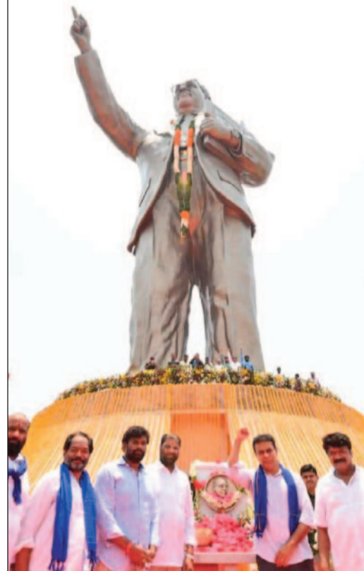
ప్రయత్నాలు జరుగుతున్నాయి.. మహాత్మా గాంధీ లాగే అంబేద్కర్ అందరి వాడని స్పష్టం చేశారు. 'జై భీమ్, జై కేసీఆర్, జై తెలంగాణ' నినాదాలతో ముందుకు సాగుతామని కేటీఆర్ స్పష్టం చేశారు.

రాష్ట్రాన్ని సాధించారని కేటీఆర్ పేర్కొన్నారు. గురుకులాలను రేవంత్ రెడ్డి ప్రభుత్వం పట్టించుకోవడం లేదని విమర్శించారు. గురుకులాల్లో మరణ మృదంగం మోగుతోందని ఆవేదన వ్యక్తం చేశారు. కాంగ్రెస్ పార్టీ అంబేద్కర్ ను రాజకీయ అవసరాలకు మాత్రమే వాడుకుంటోంది తప్ప.. ఎన్నడూ నిజమైన గౌరవం ఇవ్వలేదని విమర్శించారు. కాంగ్రెస్ ప్రభుత్వం ఉన్నంత కాలం అంబేద్కర్ కు భారతరత్న ఇవ్వలేదన్నారు. అంబేద్కర్ అభయ హస్తం పథకాన్ని అమలు చేయకుండా ఆయనను అగౌరవపరుస్తున్నారని ఆరోపించారు. దళిత బంధు లాంటి పథకాలను తీసుకొచ్చిన కలేజా ఉన్న నాయకుడు కేసీఆర్ అని కేటీఆర్ కొనియాడారు. ఎస్సీ, ఎస్టీ, బీసీలకు ప్రభుత్వ కాంట్రాక్టుల్లో అవకాశాలు ఇస్తామని కాంగ్రెస్ మోసం చేసిందని మాజీ మంత్రి విమర్శించారు. లక్షన్నర కోట్ల కాంట్రాక్టుల్లో 72 శాతం ఎస్సీ, ఎస్టీ, బీసీలకు ఇచ్చారా అని ప్రశ్నించారు. మూసి కాంట్రాక్టు ఎస్సీ, ఎస్టీ, బీసీలకు ఇస్తారా అని నిలదీశారు. కాంగ్రెస్ మోసాలను రాష్ట్రంలోని ప్రతి దళిత, బీసీ, మైనార్టీ కుటుంబాలకు చేర్చి పోరాడాలని కేటీఆర్ పిలుపునిచ్చారు. ఏప్రిల్ 20న జగిత్యాలలో జరిగే బహిరంగ సభకు కేసీఆర్ హాజరవుతాని ప్రకటించారు. కాంగ్రెస్ డిక్షనరీపై బహిరంగ సభలు నిర్వహించేలా ఎ+-లాన్ చేసుకోవాలని సూచించారు. పార్లమెంట్ భవనానికి అంబేద్కర్ పేరు పెట్టాలని బీజేపీని డిమాండ్ చేశామని.. అసెంబ్లీలో తీర్మానం కూడా చేశామని కేటీఆర్ తెలిపారు. బీజేపీ, కాంగ్రెస్ వాళ్లకు ఏ మాత్రం గౌరవం ఉన్నా స్పందించే వారన్నారు. కాంగ్రెస్, బీజేపీ దొందూ దొందే అని.. అంబేద్కర్ అంటే గిట్టని వారే అని విమర్శించారు. అంబేద్కర్ ను కొందరి వాడుగా చిత్రీకరించే