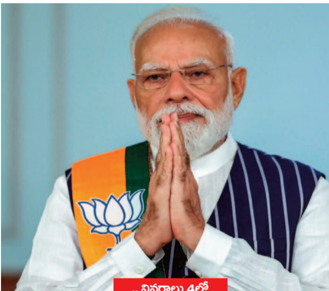
.. వివరాలు 4లో

చట్టసభల్లో వారి ఉనికి చాటేందుకు అవకాశం దేశ మహిళలకు లేఖలో ప్రధాని మోడీ వెల్లడి