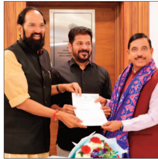
రైతుల నుంచి కొనుగోలు చేయబోతున్నాం. వరి ధాన్యం

న్యూఢిల్లీ, ఏప్రిల్ 17: 2025-26 వానాకాలం, యాసంగి సీజన్లకు సంబంధించి 30 లక్షల మెట్రిక్ టన్నుల పార్ బాయిల్ట్ ధాన్యం సేకరించాలని కేంద్రమంత్రికి సీఎం రేవంత్, మంత్రం ఉత్తమ విజ్ఞప్తి చేశారు. అలాగే యాసంగి పంట 90 లక్షల మెట్రిక్ టన్నులు వస్తుందని కేంద్రమంత్రి ప్రహ్లాద్ జోషికి సీఎం రేవంత్ వివరించారు. ఈ ధాన్యం మె-ఎత్తం కొనుగోలు చేసి తెలంగాణ రైతాంగానికి అందగా నిలవాలని కోరారు. కేంద్ర పౌరసరఫరాల శాఖ మంత్రి ప్రహ్లాద్ జోషితో తెలంగాణ సీఎం రేవంత్ రెడ్డి, మంత్రి ఉత్తమ్ కుమార్ రెడ్డి భేటీ అయ్యారు. కేంద్ర పౌరసరఫరాల శాఖ నుంచి రాష్ట్రానికి రావాల్సిన పెండింగ్ నిధులు, ఇతర అంశాలపై చర్చించారు. కేంద్ర మంత్రితో భేటీ అనంతరం మంత్రి ఉత్తమ్ కుమార్ రెడ్డి మాట్లాడుతూ.. 'దేశంలోనే అత్యధికంగా తెలంగాణలో వరధాన్యం ఉత్పత్తి జరుగుతోంది. ఈ రబీ సీజన్లో 90 లక్షల మెట్రిక్ టన్నుల వర ధాన్యం