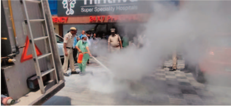
అక్షర గళం, కాప్తా :