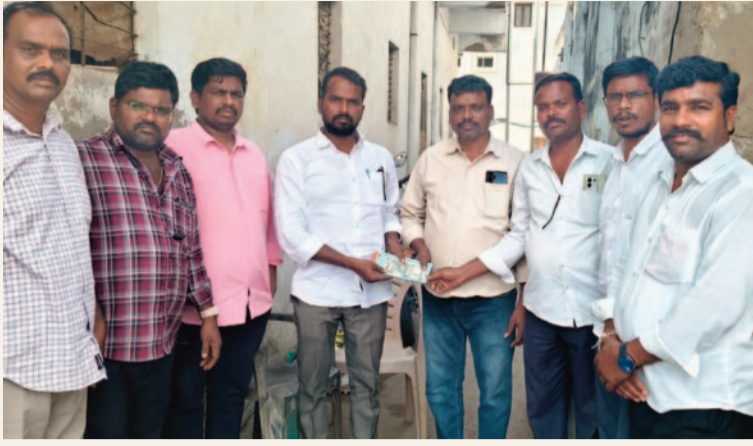
వెల్లండ ఏప్రిల్ 17 (అక్షర గళం)