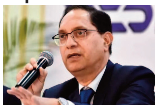
కూడా ఆయన స్పందించారు. ఈ సాంకేతికతల వల్ల వచ్చే ప్రమాదాలపై త్వరలో మార్గదర్శకాలు విడుదల చేయనున్నట్లు ఆయన వెల్లడించారు.

అభివృద్ధి, మదుపరుల రక్షణ రెండింటినీ సమతుల్యంగా కొనసాగించాలి అవసరం ఉందని ఆయన వివరించారు. సప్లయ్ మార్కెట్ నియంత్రణ అన్ని ఆర్థిక విభాగాలను బలోపేతం చేయడం తమ లక్ష్యమని తెలిపారు. బ్యాంకులు, బీమా సంస్థలు కమోడిటీ డెరివేటివ్ లో పెట్టుబడులు పెట్టే అంశంపై కూడా ఆయన స్పష్టత ఇచ్చారు. ఈ విషయంలో భారతీయ రిజర్వు బ్యాంకు, బీమా నియంత్రణ మండలి పెద్దగా సానుకూలంగా లేవని ఆయన చెప్పారు. దీనికి సంబంధించి కొన్ని కారణాలు ఉన్నాయని పేర్కొన్నారు. పెన్షన్ నిధులు కమోడిటీ డెరివేటివ్ లో పెట్టుబడులు పెట్టే అవకాశాన్ని పెన్షన్ నియంత్రణ మండలి పరిశీలిస్తున్నట్లు ఆయన తెలిపారు. అయితే ఈ అంశంపై తుది నిర్ణయం ఇంకా వెలువడని ఉందని చెప్పారు. అలాగే కృత్రిమ మేధ ఆధారిత సాంకేతికతలు మార్కెట్ పై ప్రభావం చూపే అవకాశంపై