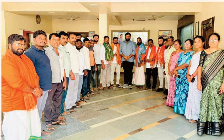
అక్షర గళం, కుత్బుల్లాపూర్ :

కుత్బుల్లాపూర్ మాజీ ఎమ్మెల్యే కునా శ్రీశైలం గౌడ్