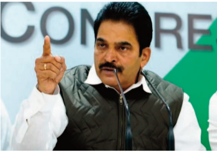
పార్టీ అధ్యక్షుడికి పరిశీలకుల నివేదిక