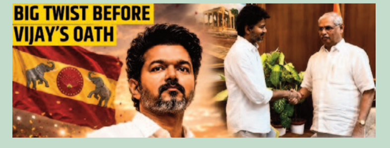
BIG TWIST BEFORE VIJAY'S OATH

సమాఖ్య వ్యవస్థలో గవర్నర్ పాత్ర ఒక సమతుల్యకర్తగా ఉండాలి. తమిళనాడు ప్రజలు ఎప్పుడూ స్వతంత్ర భావజాలంతో వ్యవహరిస్తారు, కేంద్రం నియమించిన గవర్నర్ల రాష్ట్ర రాజకీయాల్లో జోక్యం చేసుకోవడాన్ని తీవ్రంగా వ్యతిరేకిస్తారు. ఒకవేళ టీపీకే న్యాయసాహస్యాన్ని ఆశ్రయిస్తే, సుప్రీంకోర్టు తక్షణమే బలపరిక్ష (ఫీల్డీశీశీటీవర్) నిర్వహించాలని ఆదేశించే అవకాశం మెండుగా ఉంది. ఏది ఏమైనప్పటికీ, తమిళనాడు రాజకీయ చరిత్రలో ఈ ఎన్నికలు ఒక నూతన అధ్యాయాన్ని లిఖించాయి. అధికారం ఎవరికి దక్కినా, ఈ హంగ్ అసెంబ్లీ మరియు గవర్నర్ వ్యవహార శైలిపై జరుగుతున్న చర్చ భవిష్యత్తులో భారత రాజ్యాంగ విచక్షణాధికారాల పరిధిని నిర్దేశించే ఒక మైలురాయిగా మిగిలిపోతుంది.