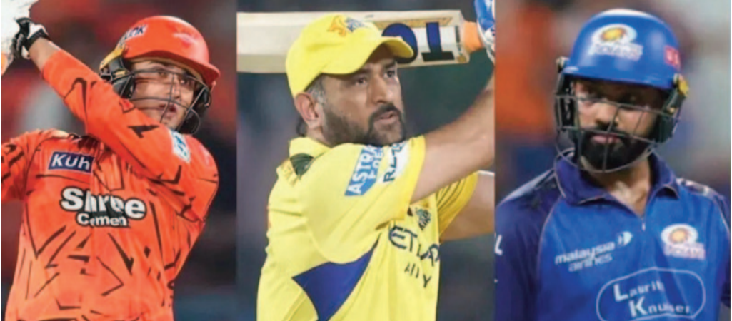
జాబితా ఇలా ఉంది: 10 సార్లు - మహేంద్ర సింగ్ ధోనీ 10 సార్లు - అభిషేక్ శర్మ 9 సార్లు - రోహిత్ శర్మ 8 సార్లు - రిషభ్ పంత్ 7 సార్లు - హార్దిక్ పాండ్యా, సూర్యకుమార్ యాదవ్, కేవల రాహుల్ ఈ మ్యాచ్లో అభిషేక్ పాటు హెట్రీక్ క్లాస్స్, ఇషాన్ కిషన్ కూడా రాణించడంతో సన్రైజర్స్ హైదరాబాద్ 235 పరుగుల భారీ స్కోరు సాధించింది. అనంతరం పంజాబ్ను 202 పరుగులకు పరిమితం చేసి 33 పరుగుల తేడాతో ఘన విజయం సాధించింది. ఈ విజయంతో హైదరాబాద్ జట్టు 14 పాయింట్లతో పాయింట్ల పట్టికలో అగ్రస్థానానికి చేరుకుంది.

హైదరాబాద్, మే 7 : ఐపీఎల్ 2026లో సన్రైజర్స్ హైదరాబాద్ యువ ఓపెనర్ అభిషేక్ శర్మ అద్భుత ఫామ్లో కొనసాగుతున్నాడు. పంజాబ్ కింగ్స్ తో జరిగిన మ్యాచ్లో మెరుపు ఇన్నింగ్స్ ఆడిన అభిషేక్, భారత స్టార్ బ్యాటర్లు రోహిత్ శర్మ, మహేంద్ర సింగ్ ధోనీ రికార్డులను టార్గెట్ చేశాడు. పంజాబ్పై కేవలం 13 బంతుల్లోనే 35 పరుగులు చేసిన అభిషేక్, ఒకే ఓవర్లో 20కి పైగా పరుగులు సాధించిన భారతీయ బ్యాటర్ల జాబితాలో ధోనీ సరసన చేరాడు. ఇప్పటివరకు ధోనీ 10 సార్లు ఈ ఘనత సాధించగా, తాజా మ్యాచ్లో అభిషేక్ కూడా 10వసారి ఈ మార్కును అందుకున్నాడు. దీంతో 9 సార్లు ఈ ఫీట్ సాధించిన రోహిత్ శర్మను అభిషేక్ వెనక్కి నెట్టాడు. ప్రస్తుతం ధోనీ మ్యాచ్లకు దూరంగా ఉండటంతో, మరోసారి 20కి పైగా పరుగులు ఒకే ఓవర్లో సాధిస్తే అభిషేక్ అగ్రస్థానాన్ని సొంతం చేసుకోవచ్చు. పంజాబ్తో మ్యాచ్లో మార్కెట్ యాన్వేన్ వేసిన ఓవర్లో అభిషేక్ విజృంభించాడు. వరుసగా సిక్సర్లు, ఫోర్లు బాదుతూ ఆ ఓవర్లో మొత్తం 21 పరుగులు రాబట్టాడు. అతడి దూకుడు బ్యాటింగ్తో సన్రైజర్స్కు శుభారంభం లభించింది. ఒకే ఓవర్లో 20కి పైగా పరుగులు సాధించిన భారతీయ బ్యాటర్