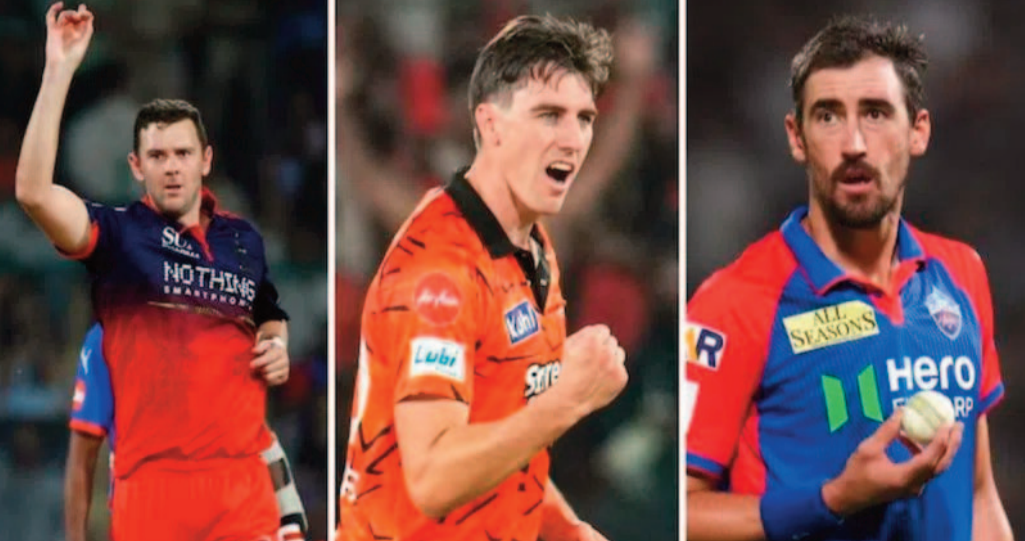
ఆటగాళ్లు ఉన్నారు. ప్రస్తుతం కమిన్స్ సన్రైజర్స్ హైదరాబాద్ కెప్టెన్గా వ్యవహరిస్తుండగా, ట్రావిస్ హెడ్ కూడా అదే జట్టుకు ఆడుతున్నాడు. హేజిల్ వుడ్ రాయల్ చాలెంజర్స్ బెంగుళూరుకు ప్రాతినిధ్యం వహిస్తుండగా, మిచెల్ స్టార్క్ ఢిల్లీ జట్టులో ఉన్నాడు. మార్క్ ఇంగ్లిస్ లక్నో సూపర్ జెయింట్స్ తరపున ఆడుతున్నాడు. స్టోయిన్స్, బార్ట్లెట్, కొన్వెల్జీ పంజాబ్ కింగ్స్ జట్టులో భాగంగా ఉన్నారు. ఆస్ట్రేలియా బోర్డు నిర్ణయంతో ఫ్లే ఆఫ్ కు చేరే జట్లకు ఇది పెద్ద ఊరటనిచ్చే అంశంగా మారింది. స్టార్ ఆటగాళ్లు పూర్తి సీజన్ అందుబాటులో ఉండటంతో ఐపీఎల్ టోపీ మరింత రసవత్తరంగా మారే అవకాశాలు కనిపిస్తున్నాయి.

న్యూఢిల్లీ, మే 7: ఐపీఎల్ ప్రాంచైజీలకు ఆస్ట్రేలియా క్రికెట్ బోర్డు గుడ్ న్యూస్ చెప్పింది. పాకిస్థాన్తో జరగనున్న వన్డే సిరీస్ కంటే ఐపీఎల్ బాధ్యతలకే ప్రాధాన్యం ఇవ్వాలని తమ ఆటగాళ్లకు సూచించినట్లు తెలుస్తోంది. దీంతో పలువురు ఆస్ట్రేలియా స్టార్ క్రికెటర్లు ఐపీఎల్ ముగిసే వరకు భారత్లోనే ఉండనున్నారు. మే 30 నుంచి పాకిస్థాన్తో ఆస్ట్రేలియా మూడు వన్డే సిరీస్ ఆడనుంది. షెడ్యూల్ ప్రకారం కంగారూ జట్టు మే 22న ఇస్లామాబాద్ చేరుకోవాల్సి ఉంది. అయితే ఐపీఎల్ 19వ సీజన్ మే 31 వరకు కొనసాగునుండటంతో ఫ్లే ఆఫ్, ఫైనల్లో పాల్గొనే ఆటగాళ్లకు మినహాయింపు ఇచ్చినట్లు సమాచారం. దీంతో వన్డే కెప్టెన్ స్ట్యూవ్ కమిన్స్ సహా దాదాపు పన్నెండుమంది ఆటగాళ్లు పాకిస్థాన్ పర్యటనకు దూరంగా ఉండే అవకాశం కనిపిస్తోంది. సాధారణంగా ట్రైనింగ్ సిరీస్ల సమయంలో ఆటగాళ్లను వెంటనే జాతీయ జట్టులో చేరాలని ఆస్ట్రేలియా బోర్డు ఆదేశిస్తుంది. కానీ ఈసారి మాత్రం ఐపీఎల్ పూర్తయ్యాకే రావచ్చని చెప్పడం విశేషంగా మారింది. ఐపీఎల్ కోసం పాకిస్థాన్ సిరీస్కు దూరమయ్యే అవకాశమున్న ఆటగాళ్లలో వ్యూట్ కమిన్స్, మిచెల్ మార్ష్, జోష్ హేజిల్ వుడ్, మిచెల్ స్టార్క్, బార్ట్లెట్, ట్రావిస్ హెడ్, జోష్ ఇంగ్లిస్, కామెరూన్ గ్రీన్, మార్క్ స్టోయిన్స్, కూపర్ కొన్వెల్జీ వంటి స్టార్