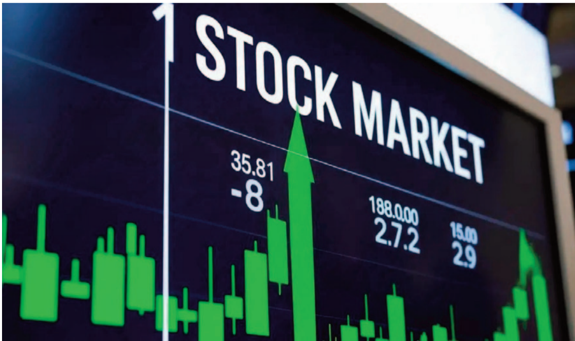
నిలబోవునీ అంచనా వేస్తున్నారు. ఇదిలా ఉండగా అంతర్జాతీయ మార్కెట్లో ముడి చమురు ధరలు భారీగా తగ్గాయి. అమెరికా-ఇరాన్ మధ్య ఒప్పందం కుదిరే అవకాశాలపై వచ్చిన వార్తలతో బ్రెంట్ క్రూడ్ ధర 2.74 శాతం తగ్గి బ్యారెల్కు 98.50 డాలర్లకు చేరింది. చమురు ధరలు తగ్గడంతో పాటు అంతర్జాతీయ సానుకూల సంకేతాల ప్రభావంతో రూపాయి కూడా బలపడింది. డాలర్తో పోలిస్తే రూపాయి విలువ 15 పైసలు పెరిగి 94.24 వద్ద ట్రేడింగ్ ముగించింది.

ముంబయి, మే 7 : దేశీయ స్టాక్ మార్కెట్లు గురువారం స్వల్ప నష్టాలతో ముగిశాయి. రోజంతా పరిమిత శ్రేణిలో కదలాడిన సూచీలు చివరికి ఫ్లాట్ ధోరణిలో స్థిరపడ్డాయి. అంతర్జాతీయంగా గల్ఫ్ ప్రాంత పరిణామాలు, అమెరికా-ఇరాన్ చర్చలపై ఇన్వెస్టర్లు దృష్టి సారించడంతో మార్కెట్లో జాగ్రత్త ధోరణి కనిపించింది. ట్రేడింగ్ ముగిసే సమయానికి బీఎస్ఎస్ సెన్సెక్స్ 114 పాయింట్లు తగ్గి 77,844.52 వద్ద నిలిచింది. ఎన్ఎస్ఎస్ఎస్ సూచీ కూడా స్వల్పంగా 4.30 పాయింట్లు కోల్పోయి 24,326.65 వద్ద ముగిసింది. ప్రధాన సూచీలు బలహీనంగా కనిపించినప్పటికీ, బ్రాడర్ మార్కెట్లు మాత్రం లాభాల్లో కొనసాగాయి. నిస్టీ మిడ్కాప్ సూచీ 1.20 శాతం, స్మాల్కాప్ సూచీ 0.97 శాతం మేర పెరిగాయి. ఇది మధ్యతరహా, చిన్నతరహా షేర్లలో కొనుగోళ్ల ఆసక్తి కొనసాగుతున్నట్లు సూచిస్తోంది. రంగాల వారీగా ఆటో షేర్లు మంచి ప్రదర్శన కనబరిచాయి. మరోవైపు ఐటీ, ఎఫ్ఎస్ఐ, కన్స్యూమర్ డ్యూరబుల్స్ రంగాలు ఒత్తిడికి లోనయ్యాయి. ముఖ్యంగా హిందుస్థాన్ యూనిలివర్, టీసీఎస్, టైటన్ వంటి ప్రముఖ కంపెనీల షేర్లు నష్టాల్లో ముగియడంతో సూచీలపై ప్రభావం పడింది. మార్కెట్ నిపుణుల ప్రకారం నిస్టీకి 24,400 నుంచి 24,500 స్థాయిలు కీలక అవరోధంగా మారాయి. ఈ స్థాయిని అధిగమిస్తే మార్కెట్ మరింత పుంజుకునే అవకాశాలు ఉన్నాయని చెబుతున్నారు. మరోవైపు అమ్మకాల ఒత్తిడి పెరిగితే 24,000 స్థాయి కీలక మద్దతుగా