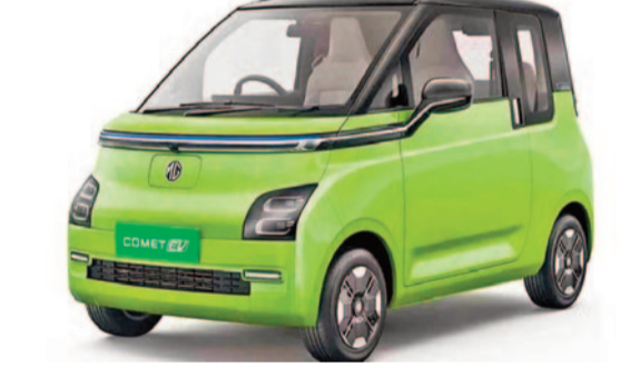
కూడా రెండింతలు పెరిగి 2,245 యూనిట్లకు చేరుకున్నాయి. ఇంధన ధరలు పెరుగుతుండటంతో పాటు ఛార్జింగ్ మౌలిక వసతులు మెరుగుపడటం, కొత్త మోడళ్లు మార్కెట్లో రావడం వల్ల రాబోయే నెలల్లో కూడా ఈవీ రంగం మరింత వేగంగా విస్తరించే అవకాశాలు కనిపిస్తున్నాయి.

ముందంజలో నిలిచింది. కంపెనీ ఏప్రిల్లో 8,543 ఎలక్ట్రిక్ కార్లను విక్రయించింది. ఇది గత ఏడాదితో పోలిస్తే 77 శాతం అధికం. మహీంద్రా అండ్ మహీంద్రా 5,413 యూనిట్లు విక్రయించగా, జేఎన్ఎస్ఎస్ఎల్ కంపెనీ 37,683 యూనిట్లతో అగ్రస్థానంలో నిలిచింది. బజాజ్ ఆటో 32,898 వాహనాలు విక్రయించగా, ఏఫర్ ఎస్ఎస్ 27,034 యూనిట్లు విక్రయించింది. అదేవిధంగా ఎలక్ట్రిక్ ట్రిచక్ర వాహనాల విక్రయాలు కూడా పెరిగాయి. గత నెలలో 64,549 ఎలక్ట్రిక్ ట్రిచక్ర వాహనాలు అమ్ముడయ్యాయి. ఎలక్ట్రిక్ కమర్షియల్ వాహనాల విక్రయాలు