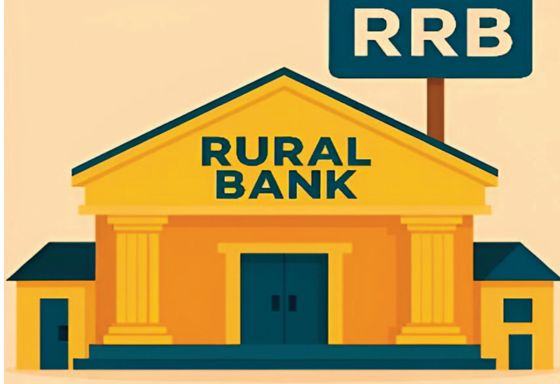
ప్రాంతీయ గ్రామీణ బ్యాంకుల ఆర్థిక స్థిరత్వాన్ని పెంచడంతో పాటు, గ్రామీణ ఆర్థిక వ్యవస్థకు మరింత మద్దతు అందించడంలో ఈ సంస్కరణలు కీలకంగా మారుతున్నాయని అధికారులు భావిస్తున్నారు.

న్యూఢిల్లీ, మే 7 : ప్రాంతీయ గ్రామీణ బ్యాంకుల పనితీరును మరింత బలోపేతం చేయడానికి కేంద్ర ప్రభుత్వం కీలక నిర్ణయం తీసుకుంది. గ్రామీణ బ్యాంకుల్లో సంస్కరణల కోసం రూపొందించిన 'చయబిలిటీ ప్లాన్ 2.0'కు కేంద్ర ఆర్థిక సేవల విభాగం ఆమోదం తెలిపింది. ఈ ప్రణాళిక 2025-26 నుంచి 2027-28 ఆర్థిక సంవత్సరాల వరకు అమల్లో ఉండనుంది. ప్రాంతీయ గ్రామీణ బ్యాంకుల ఆర్థిక స్థితి, పరిపాలనా వ్యవస్థ, పనితీరు పర్యవేక్షణను మెరుగుపరచడమే ఈ ప్రణాళిక ప్రధాన లక్ష్యంగా కేంద్ర ప్రభుత్వం పేర్కొంది. గతంలో 2021-22 నుంచి 2024-25 వరకు అమలైన తొలి చయబిలిటీ ప్రణాళిక మంచి ఫలితాలు ఇవ్వడంతో ఇప్పుడు దాన్ని మరింత విస్తృతంగా అమలు చేయాలని నిర్ణయించారు. కొత్త ప్రణాళికలో మొత్తం 30 పనితీరు ప్రమాణాలను చేర్చారు. కార్యాచరణ సామర్థ్యం, ఆస్తుల నాణ్యత, లాభదాయకత, వృద్ధి వంటి నాలుగు ప్రధాన అంశాల ఆధారంగా బ్యాంకుల పనితీరును అంచనా వేయనున్నారు. డిపాజిట్లు, రుణాల నిష్పత్తి, డిజిటల్ సేవల వినియోగం, రికవరీ శాతం, లాభదాయకత, కేంద్ర ప్రభుత్వ పథకాల అమలు వంటి అంశాలను ప్రత్యేకంగా పరిశీలించనున్నారు. గ్రామీణ ప్రాంతాల్లో బ్యాంకింగ్ సేవలను మరింత బలోపేతం చేయడం, డిజిటల్ బ్యాంకింగ్ను విస్తరించడం, రైతులు మరియు గ్రామీణ ప్రజలకు రుణ సదుపాయాలను సులభతరం చేయడం ఈ ప్రణాళికలో కీలక భాగంగా ఉండనుంది. దేశవ్యాప్తంగా ఉన్న 28