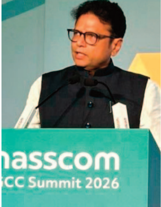
అలాంటి చారిత్రక తప్పిదాన్ని హైదరాబాద్ విషయంలో తాము చేయానుకోవడం లేదన్నారు. అందుకే... భవిష్యత్తు కోసం ఎదురు చూడకుండా, దాన్ని నిర్మించే బాధ్యతను తీసుకున్నామన్నారు. ఆ దిశగానే భారత్ పూర్వ సిటీ, ఏబి