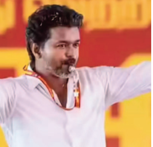
కాంగ్రెస్ లోని ఒక వర్గం కూడా టిఎంకె పట్ల సానుకూలంగా ఉండటంతో, మరొకొన్ని స్థానాల మద్దతుతో విజయ్ ముఖ్యమంత్రి పీఠాన్ని అధిరోహించడం దాదాపు ఖాయంగా కనిపిస్తోంది. అవినీతి, వారసత్వ రాజకీయాలకు వ్యతిరేకంగా ప్రజలు ఇచ్చిన ఈ తీర్పుతో చెన్నైలోని టిఎంకె ప్రధాన కార్యాలయం సంబరాలతో హోరెత్తిపోతోంది.