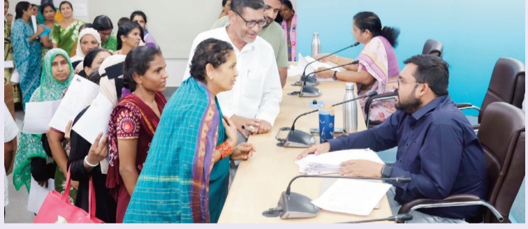
అక్షర గళం, మేడ్చల్ ప్రతినిధి :

మేడ్చల్ మల్కాజిగిరి అదనపు జిల్లా కలెక్టర్ హైజాన్ అహ్మద్