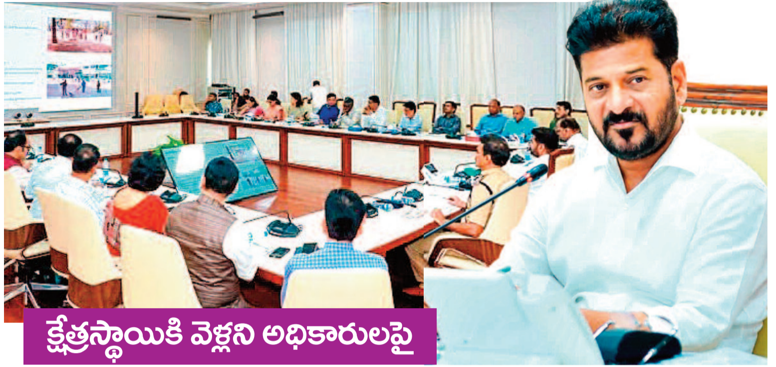
క్షేత్రస్థాయికి వెళ్లని అధికారులపై