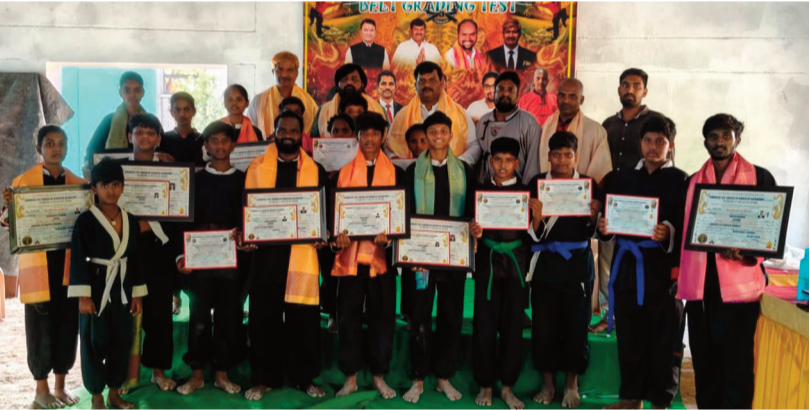
వెల్లండ్ జూన్ 15 (అక్షర గళం)

వెల్లండ్ మండల కేంద్రంలోని మోడల్ స్కూల్లో సోమవారం చైనీస్ లీ షాపోలిన్ కుంగ్ పూ మరియు లియోపార్ట్ షాపోలిన్ కుంగ్ పూ అకాడమీ ఆధ్వర్యంలో బెల్ట్ డ్రేడింగ్ టెస్ట్ (పరీక్షలు) ఘనంగా నిర్వహించబడ్డాయి. ఈ కార్యక్రమానికి ముఖ్య