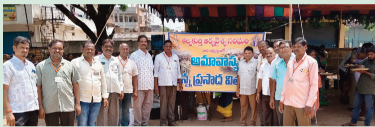
కల్వకుర్తి, జూన్ 15 (అక్షర గళం):